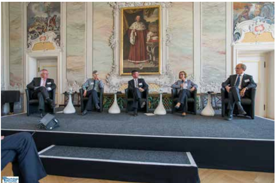
Forum I