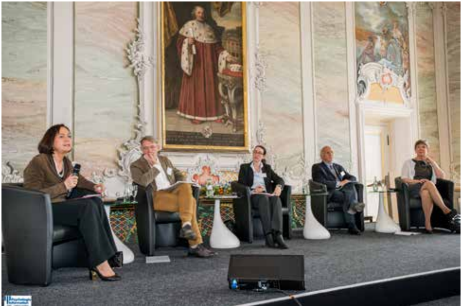
Forum II