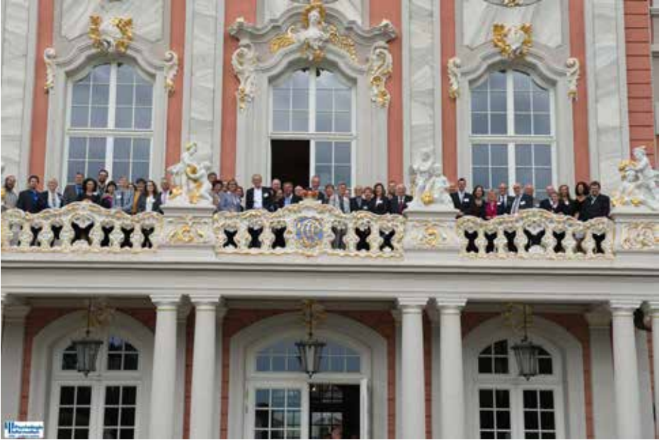
Teilnehmerinnen und Teilnehmer des Symposiums am 3. Juni 2016